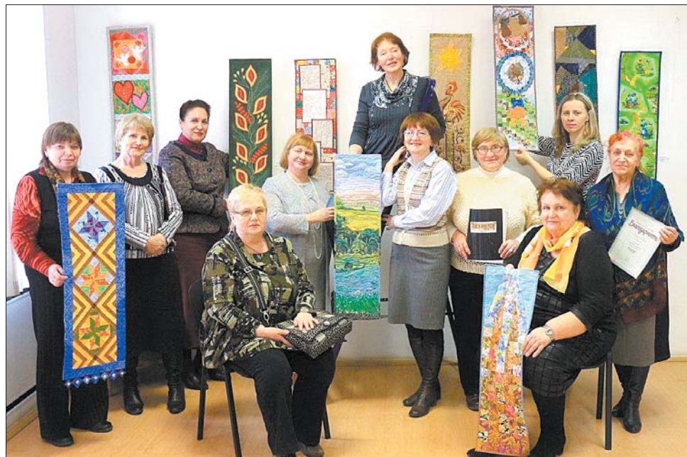
Члены клуба «Рошва».

абменьваюцца інфармацыяй, вопытам. І такіх фанатаў шыцця са шматкоў, не паверыце, тысячы! — Праўда, чамусьці ў былым СССР іх ня многа. Дакладна ведаю, што ў Расіі мужчын, якія на добрым узроўні ствараюць творы, трое. Ведаю кожнага. Нашы мужыкі, напэўна, лянуюцца (смяецца). Навучыла і сына, але ён аддае перавагу мужчынскім хобі... Гэты від творчасці станоўча ўплывае на стан здароўя, працягвае жыццё, упэўнена Ніна Ярмух. Замежныя навукоўцы правялі адпаведнае даследаванне. Справа ў тым, што тканіны розныя па фак-