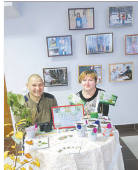
Пачапоўская школа ўжо зарабляе грошы на сваім праекце.