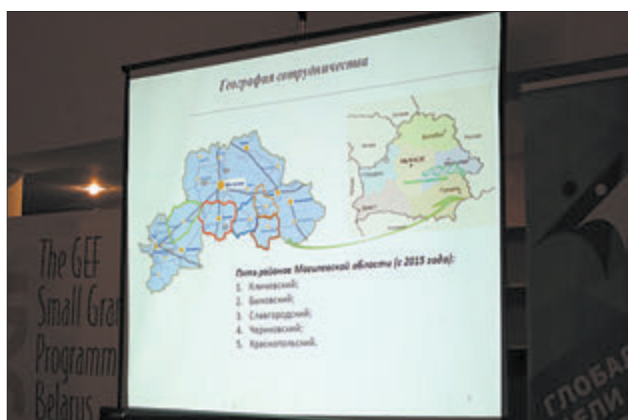
З 21 раёна Магілёўскай вобласці ўжо пяць актыўна развіваюць праектную дзейнасць.

Са Слаўгарада на кірмаш прыехала аж некалькі прадстаўнікоў, чые праекты паспяхова рэалізаваліся і развіваюцца далей.