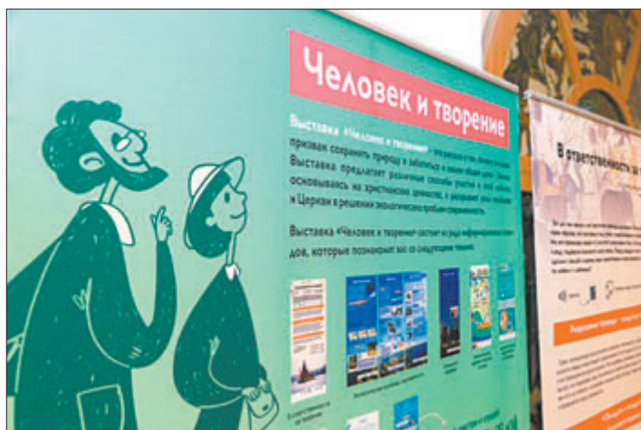
3 гэтага стэнда ўсё пачынаецца.