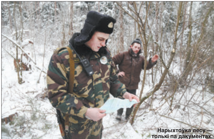
Нарыхтоўка лесу — толькі па дакументах.

Наталля ЛУБНЕЎСКАЯ.