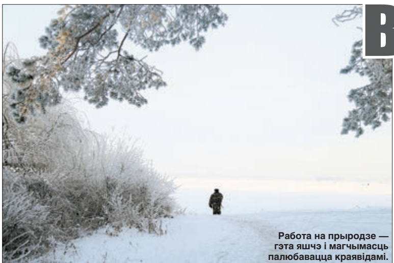
Работа на прыродзе — гэта яшчэ і магчымасць палюбавацца краявідамі.