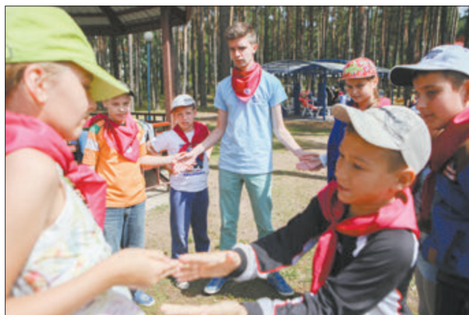
«Лячэй лебедзь, зламаў крыло»...