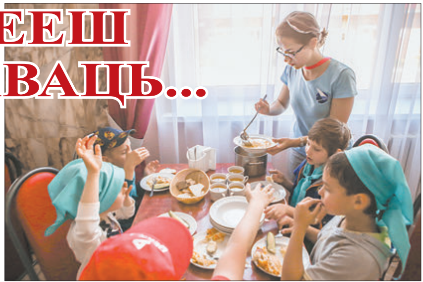
Пад прыцэлам фотакамеры ахвотнікаў ёсць суп большае.

Надвор'е сёння сонечнае, таму ў карпусах амаль нікога няма. Усе