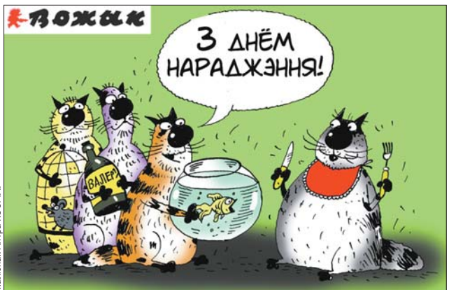
Малюнак Петра ЮЗІНА.

«Ці адзначаць гадавіну высялення пасля разводу?» і іншыя крэатыўныя падставы выпіць.