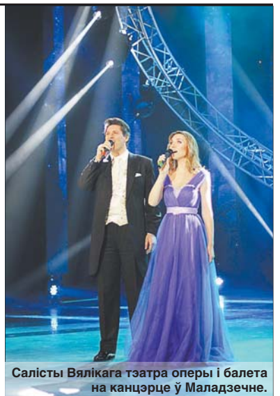
Салісты Вялікага тэатра оперы і балета на канцэрце ў Маладзечне.