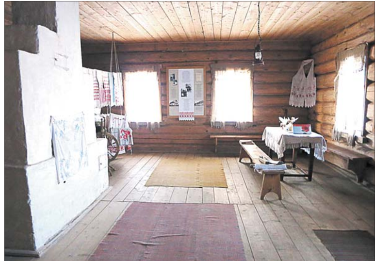
Інсталцыя музея паўтарае абстаноўку вясковага пакоя пачатку XX стагоддзя.

ні душы, нават аўтакрама насупраць будынка стаіць у адзіноце. Кіроўца сумуе ў кабіне, кажа, што прыходзілі некалькі жыхароў, але яны ўжо купілі ўсё, што ім трэба, і пайшлі.