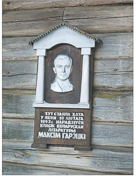
Дом-музей быў створаны да 100-годдзя пісьменніка.

ны асадак ад таго, што знеслі дом у Горках, дзе жыў Максім Гарэцкі. Там бывалі такія знакамтыя людзі XX стагоддзя, як Юрка Гаўрук, Якуб Колас, Паўліна Мядзёлка. На будынку мелася памятная дошка, што там жыў Максім Гарэцкі. Але дом знеслі, і нічога не засталася. Абяцалі паставіць памятны знак, аднак яго дагэтуль няма. Тут таксама не ведаю, што атрымаецца. Ды і як гэта наогул успрымаць? Які ж гэта будзе музей Гарэцкага, калі ён нарадзіўся ў вёсцы? Там яго асяроддзе. Уяўляецца, што было б, калі б музей з Міхайлаўскага перанеслі ў Пскоў?