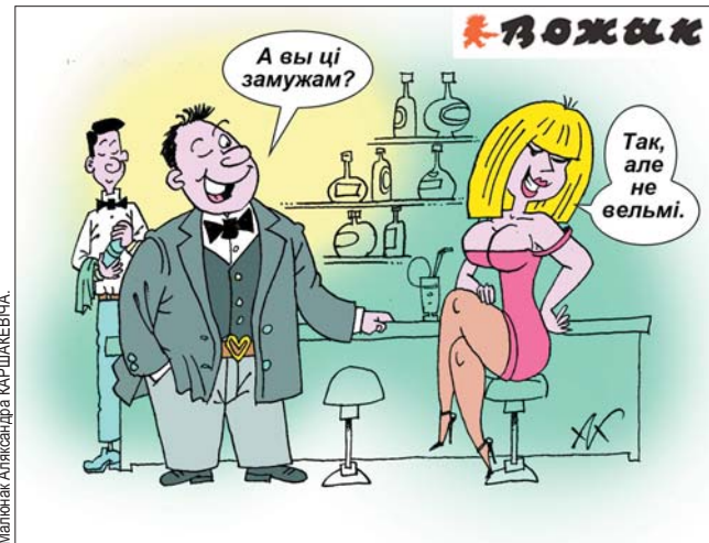
Малюнак Аляксандра КАРШКЕВІЧА.

Мама размаўляе з дачкой: — Якая ж ты ўсё-ткі шкодніца... — Усе прэтэнзіі да вытворцаў!