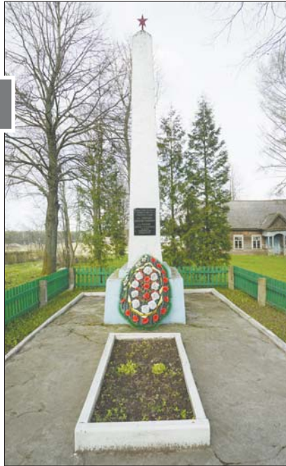
Помнік лётчыкам у вёсцы Камянец.