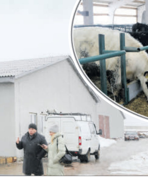
Новы памяшканні жывёлагадоўчага комплексу.