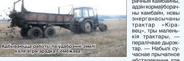
Адбываюцца работы па ўдаразненні зямлі каля аграпрадсва Семежава.

— У планах — пабудавец таксама памяшканні для сухастой і раздоу, — кажа аб найбліжэйшых перспектывах кіраўнік. — Дабудуваем прафілак-торый для цялят на 300 галоу, каб цяляткі ад нуля і да трох месяцаў знаходзіліся ў цёплым памішканні, пад дахам.