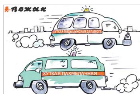
Малюнак Леаніда ГАДУНА / Міхаіл СТОЎПАНЕНКІ.