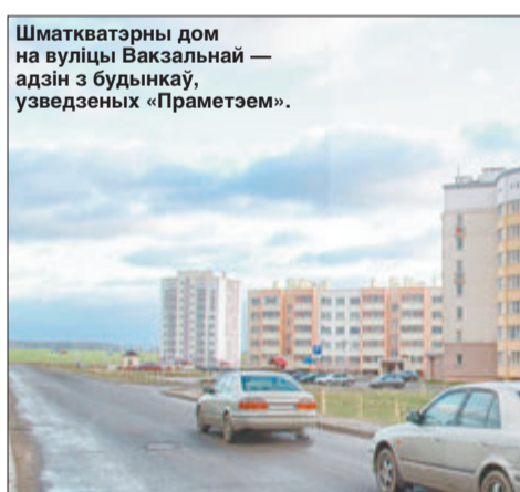
Шматкватэрны дом на вуліцы Вакзальнай — адзін з будынкаў, узведзеных «Праметэем».