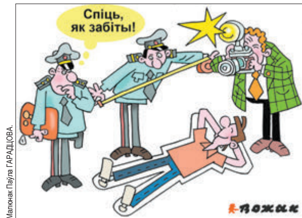
Малюнак Паўла ГАРДЦЮБА.

Як выявіць на банкамате счывальную прыладу?