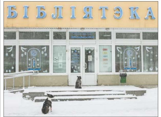
Фота Сяргея НИКАНОВІЧА.

Пр. Пачатак Вялікага Паста. Марыі, Аляксея, Антона, Мялецыя, Яўгена. К. Анастасіі, Віктара, Цэзара, Яраслава.