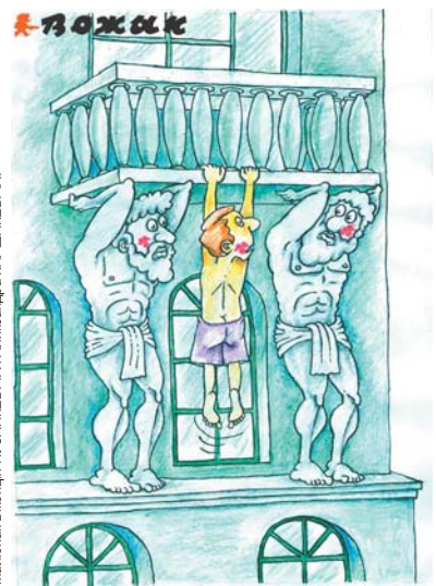
Малюнак Віленцы ПУЗАНКЕВІЧА / Аляксандра КАРШАКЕВІЧА.

— А навошта ўсё гэта? — Каб атрымаўся натуральны колер твару.