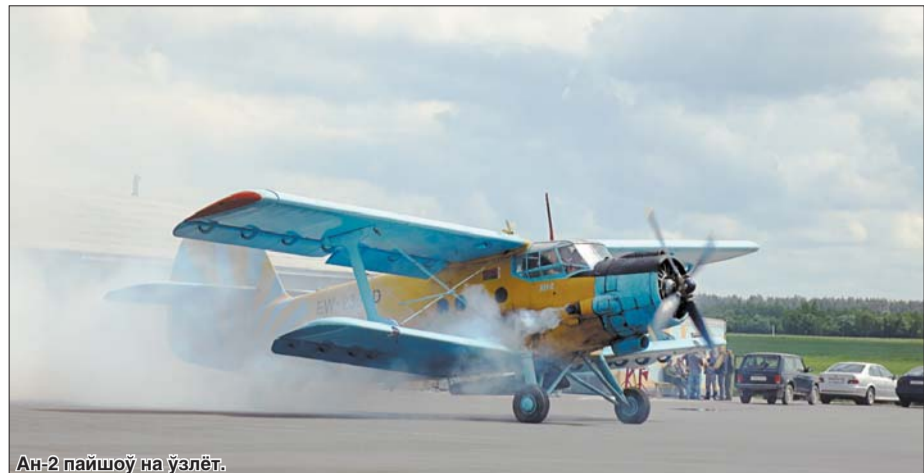
Ан-2 пайшоў на узлёт.