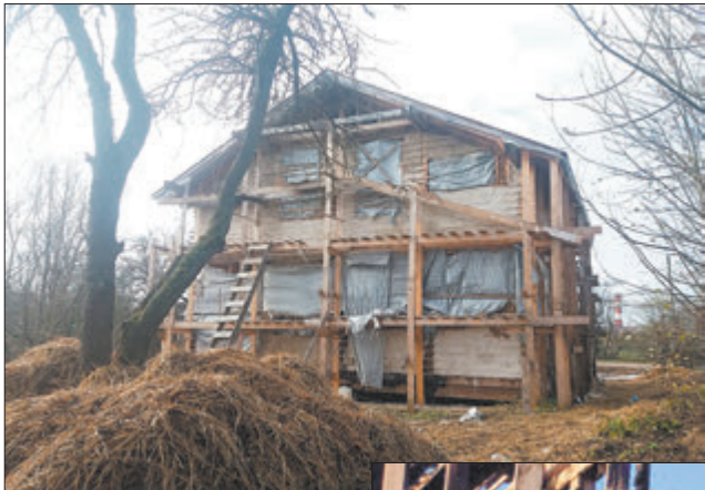
Дом мары сям'і Рамановічаў да пажару і пасля.

— Пасля пажару шмат хто раіў нам аддаць перавагу цэглае ці блокам. Але мы, нягледзячы ні на што,