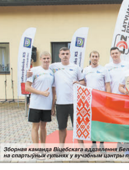
Зборная каманда Віцебскага аддзялення Беларускай чыгуначнай спартыўнай гульні ў вучэбным цэнтры прафсаюза чыгуначнікаў і галіны зносіў у Латвіі.

У красавіку наш прафсаюз звяртаўся ў Федэрацыю прафсаюзаў Беларусі па пытанні прызначэння датэрміновых пенсій некаторым катэгорыям работнікаў, занятым у асаблівых