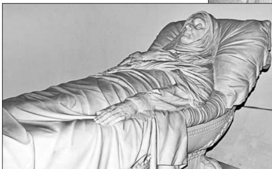
Мяркуючы па вышыні аблямаванай ці то бедфордскімі, ці то лільскімі, ці то малінскімі карункамі падушкі, збіралася прылегчы ненадоўга.

У раёне Морына неверагодна хуткая сувязь з нябёсамі. Не паспелі сказаць: «Каб ты з'ехаў!» грузавічку-дальнабойшыку, як ён саступіў нам шлях.