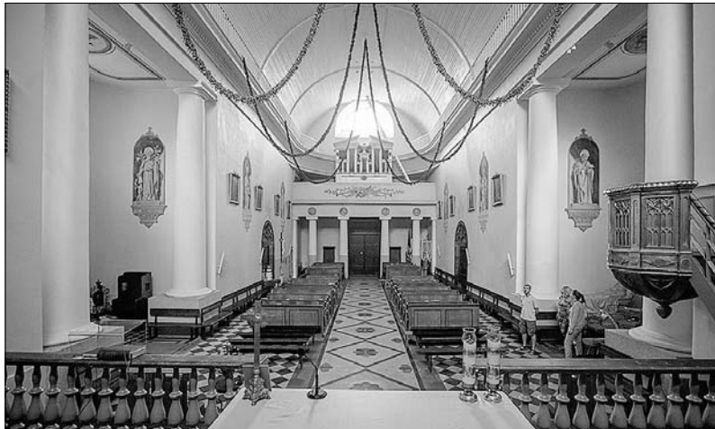
Здымкі рабіць не хацелася. Знайшліся ў калег. Траецкі касцёл знутры.