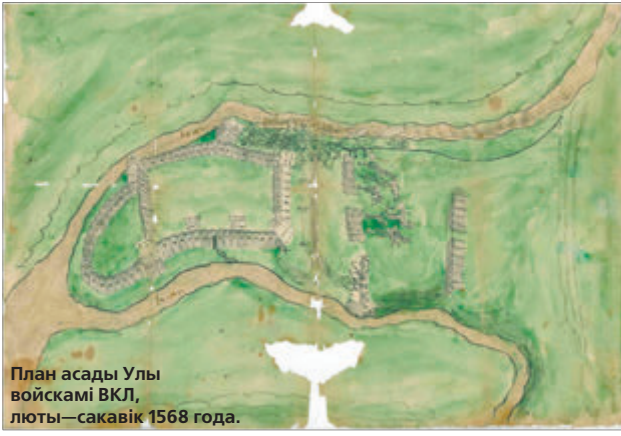
План асады Улы войскамі ВКЛ, люты—сакавік 1568 года.

— Няспынныя баявыя дзеянні і пагроза знішчэння ўносілі істотныя карэктывы ў жыццёвы ўклад насельніцтва. Пры сціплых магчымасцях казны ВКЛ уладам цяжка было пастаянна ўтрымліваць тут значны наёмны гарнізон. І яны паспрабавалі вырашыць пытанне забеспячэння абараназдольнасці Улы іншым шляхам, які быў