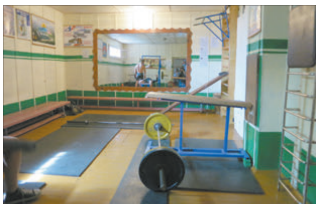
Так званая трэнажорная зала.

Загадчык базы Кірыл Цярэнцьеў толькі паціскае плячыма і не без іроніі кажа: «Нацэборна Беларусі таксама тут займаецца падчас збораў і не плача». Маўляў, усе ў краіне даўно ў курсе, якія тут умовы.