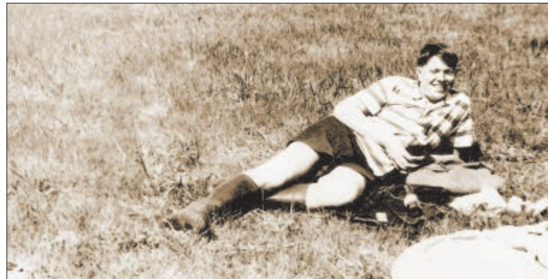
«Яны прыпаўзлі, яны і адпаўзучы, як чэрві. А чалавек, чалавецтва, культура, мова, нацыя жылі і будуць жыць вечна».

«Што тычыцца душ людскіх, то тут страты ідуць за кошт яшчэ жы-