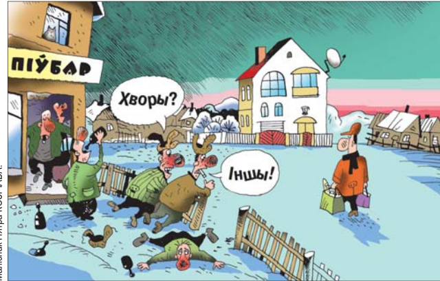
Малюнак Тэтра ЮСІЯЧУВА.