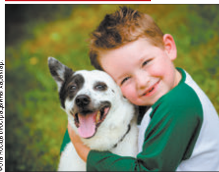
Фота: ілюстрацыя характар.

У суботу тата выправіўся на рыбалку, а мы з мамай — у горад. Збіраліся схадзіць у парк і пакатацца на каруселях.