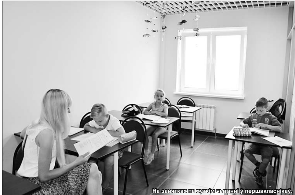
На занятках па хуткім чытанні ў першакласнікаў.

Натуральна, каб захаваць вынік, трэба працягваць рэгулярна займацца дома. На гэта робіцца акцэнт. І тут ужо ўсё залежыць ад бацькоў. Дарэчы, увесь працэс навучання пабудаваны на ўзаемадзейні педагог—вучань—бацькі. У апошніх нават ёсць спецыяльныя дапаможнікі, якія змяшчаюць падрабязнае апісанне метадык навучання. Пасля кожных заняткаў праводзіцца бацькоўскі сход. Выклад-