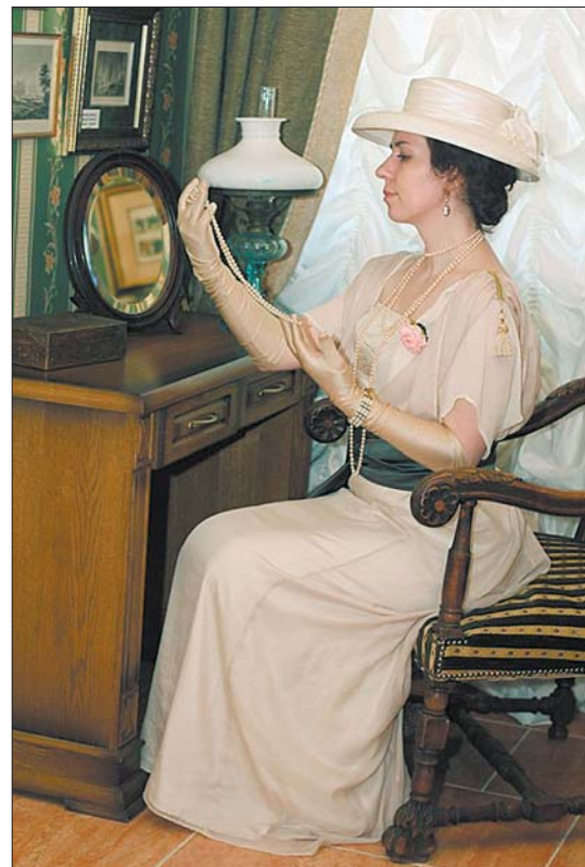
Аднойчы з бальнай супольнасці выдзелілася касцюмная супольнасць. Вынікам гэтага стала выстава рэпрадукцый гістарычных убораў «Куфэрак».

З цягам часу з нашай бальнай супольнасці выдзелілася касцюмная супольнасць. Вынікам гэтага нашага захаплення стала выстава рэпрадукцый гістарычных касцюмаў, якія мы шыем самі, — «Куфэрак». Пачыналася ўсё з таго, што вельмі хацелася знайсці