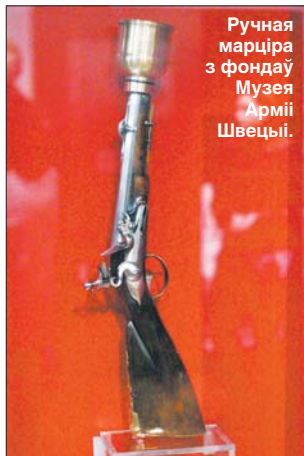
Ручная марціра з фонду Музея Арміі Швецыі.

у грэкі. З даўніх часоў у вас захаваліся месцы з назвамі Швецы, Шведская Гара, Шведскі Курган, Шведскі Шлях. У Магілёўскай вобласці ёсць вёска Свенск, што ў перакладзе з маёй роднай