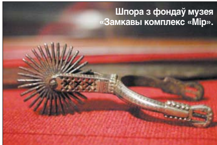
Шпора з фонду музея «Замкавы комплекс «Мір».

— Па-першае, Мірскі замак — гэта вельмі сімвалічнае месца. У сярэдзіне XVII стагоддзя, пра якое вядзецца размова на выстаўцы, замак яшчэ выкарыстоўваўся як абарончае збудаванне Рэчы Паспалітай. А ў XVIII стагоддзі ён ужо страціў такую функцыю, і тады краіна стала фактычна «праходным дваром». Гісторыя Паўночных войнаў нас шмат чаму вучыць у разуменні тагачасных палітычных і сацыяльных умоў. Па-другое, мы