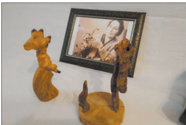
Стэфанія Станюта і яе «журавок», знойдзены на марскім беразе. Вялікая актрыса часта ўдзельнічала ў выстаўках секцыі «Прырода і фантазія» і з задавальненнем дарыла свае работы тым, каму яны падабаліся.

крысе іншых. Трэба ісці да людзей і несці ім творчасць, тады майстры падцягнуцца». І сапраўды, падцягнуліся: сярод цяперашніх удзельнікаў клуба — звыш 50 майстроў ва ўзросце ад 17 да 85 гадоў, якія займаюцца рознымі відамі вышэйшай, вязаннем, стужкавым дэкорам, бацікам, выпальваннем па дрэве і тканіне, разьбярствам, керамікай, фларыстыкай, прыроднай скульптурай, жывапісам... Практычна ўсіх кіраўнік ведае пайменна і прасоўвае іхнія творы ў мастацкія экспазіцыі, што выстаўляюцца, напрыклад, у сталічных і раённых бібліятэках, дамах культуры, цэнтрах народнай творчасці, у школах і гімназіях. Мінск, Полацк, Івянец, Мар'іна Горка, Навагрудак, Мядзел, Лагойск, Бабруйск, Іўе... Толькі за апошнія дзесяць гадоў выстаўкі клуба «Прырода і фантазія» прайшлі ў 60 беларускіх гарадах і мястэчках.