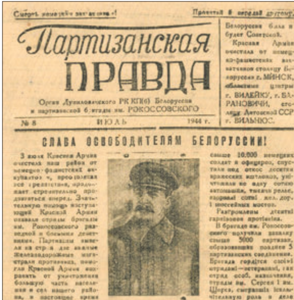
(Заканчэнне. Пачатак на 1-й стар.)

Але гісторыя падпольнага і партызанскага друку Беларусі на гэтым не завяршылася. Многія выданні працягвалі выходзіць у свет, але ўжо не ў ценю, а афіцыйна, расказваючы пра вызваленне і аднаўленне родных вёсак і гарадоў, поспехі Чырвонай Арміі на фронце, працу былых партызан. Так, у Слуцку выдавалася газета «За Сацыялістычную Радзіму», у Ваўкавыску — «Заря» (выданне існуе і па сёння пад назвай «Наш час»), у Навагрудку — «Звезда», у Лідзе — «Уперад», віцебская «Калгасная трыбуна», скідзельскае «Красное знамя» і іншыя. Як змянілася танальнасць і змест гэтых газет у час правядзення аперацыі «Баграціён» і пасля вызвалення Беларусі?