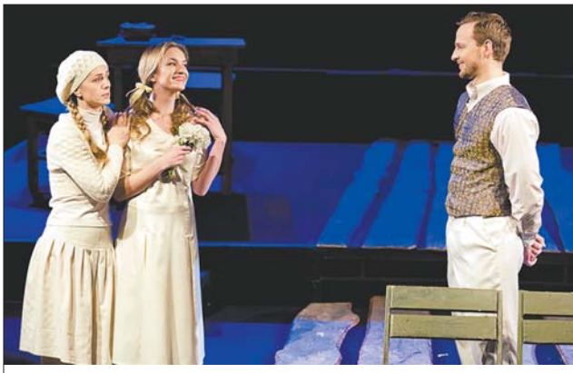
Сцэны са спектакля «Тры Жызэлі» РТБД.