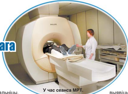
У час сеанса МРТ.

Як ужо амаль 220 гадоў ратуець жыцці ў 2-й гарадской клінічнай бальніцы