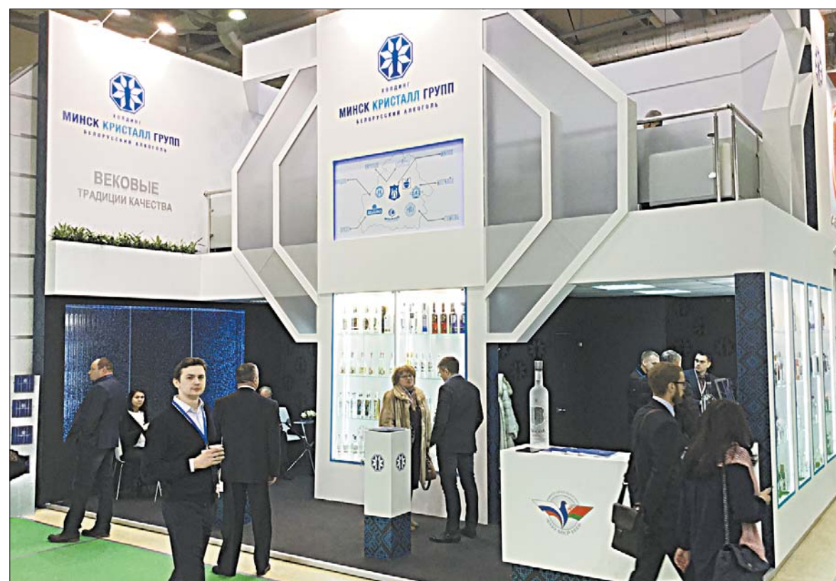
Аб'яднаны стэнд арганізацый холдынга падчас выставы «ПРАДЭКСПА-2017» у Маскве.

ААТ «МІНСК КРЫШТАЛЬ» — кіруючая кампанія холдынга «МІНСК КРЫШТАЛЬ ГРУП», першая ў краіне сярод прадпрыемстваў алкагольнай галіны, атрымала сертыфікат FSSC 22000 найноўшай міжнароднай сертыфікацыйнай сістэмы бяспекі харчовых прадуктаў. Аўдыт-сістэмы менеджменту бяспекі харчовых прадуктаў праводзіла кампанія «TUV Thüringen» (Германія). Выдадзены ёю сертыфікаты карыстаюцца даверам у Еўропе, з'яўляюцца эфектыўным сродкам маркетынгу і дакументальным пацверджаннем стабільнасці якасці, бяспекі прадукцыі і паслуг.