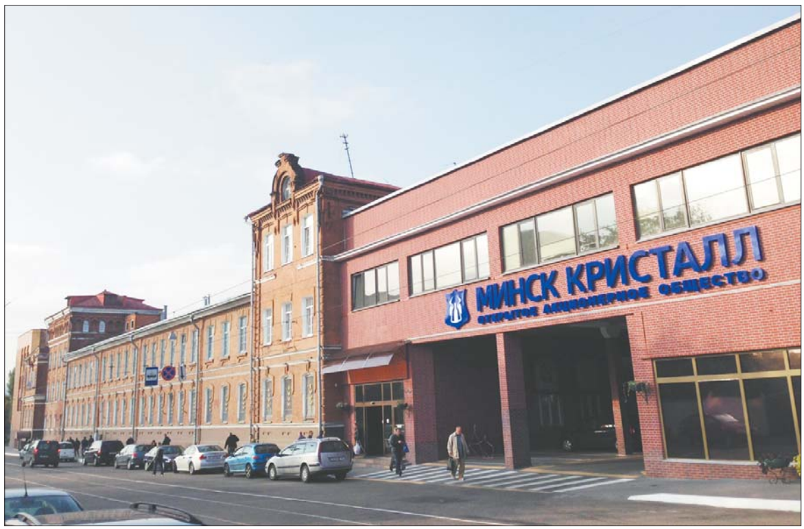
Адноўлены фасад будынка кіруючай кампаніі і гістарычная частка будынка.

За год запасы гатовай прадукцыі на складах скараціліся ўдвая, і яны па-ранейшаму мінімальныя, падтрымліваюцца на ўзроўні, неабходным, каб забяспечыць патрэбы гандлю ў асартыменце. Павялічаны рэнтабельнасць продажу, прыбытак ад рэалізацыі прадукцыі, вытворчасць працы па выручцы і дабаўленай вартасці.