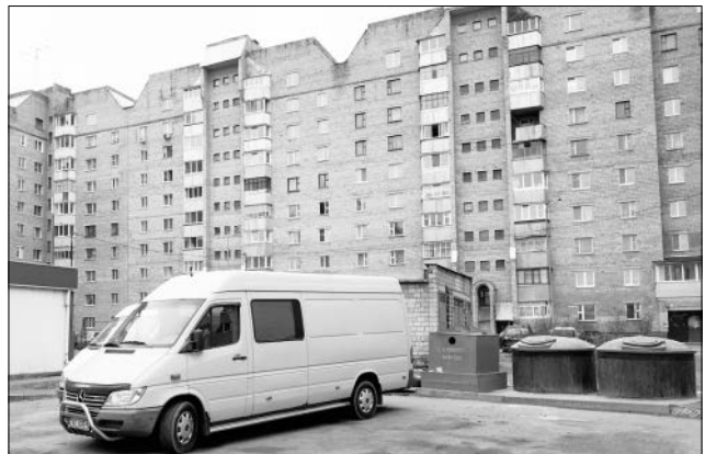
Сметнік пераехаў на аўтастанку?

— Стаў шукаць канцы і трапіў на прыём да мэра, — кажа мужчына. — На ім прысутнічалі ўсе спецыялісты па маім пытанні. Сталі казаць пра тое, што гарадок знеслі ў мэтах бяспекі, маўляў, стары быў. І тады я ім паказаў фота з 10-сантыметровымі металічнымі «пнякмі», якія засталіся ад зрэзаных спартыўных снарадаў. Мэр загадаў вярнуць спартыўны зарадак. Яго вярнулі, але ўсё зрабілі па прынцыпе — адчапіцця. А нядаўна зноў пачалі разбу-