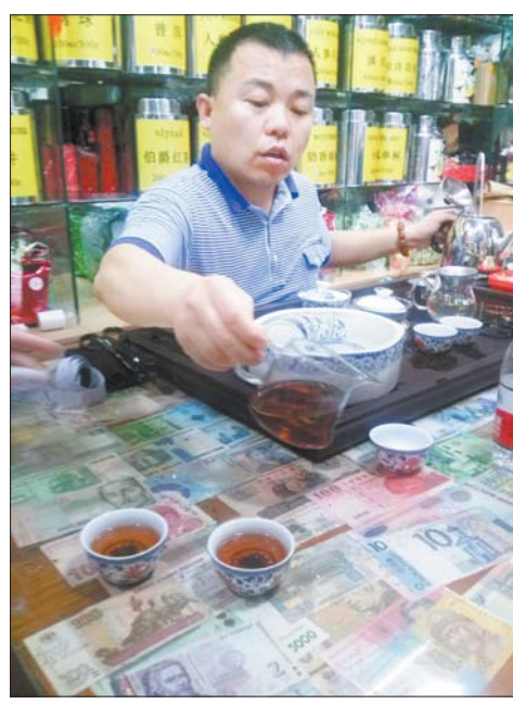
Перад тым, як прадаць, чай у Кітаі абавязкова дадуць пакаштаваць.

далікатны водар і смак. Кошт такога чаю — 2000—5000 юаняў за 500 грамаў. У гэтай вёсцы мы дэгусталі красавіцы, ліёнскі і жнінёўскі «Лун Цзін».