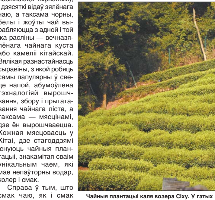
Чайныя плантацыі каля вёзкі Sixu. У гэтых мясцінах вырошчваюць самыя дарагія чай у Кітаі.