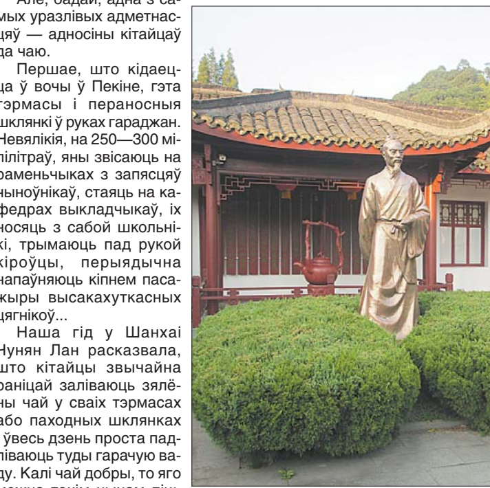
Скульптура мудраца Лу Юя, аўтар «Чайнага канона» (VIII стагоддзе) ў вёсцы Лун Цзін.

дзіцка чайная плантацыя, тым большы перапад тэмператур на працягу сутак адчувае чайны ліст. Лічым, што гэта дазваляе яму назапашваць у сабе ўсе каштоўныя рэчывы ў цэлым дзень і не выдатыкоўваць іх халоднай ноччу, адсюль у чаю багаты і доўгі смак.