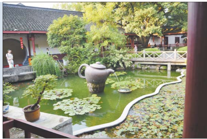
Вёска Лун Цзін, якая дала назву самаму знакамітаму кітайскаму чаю.