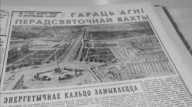
Надзельны выпуск «Звязды» пачынаючы вылучацца колерам.

У публікацыях 50-х гадоў шмат нараканняў, што ў крамах няма самага неабходнага для насельніцтва. А неабходна літаральна ўсё: дзіцячы і дарослы абутак, зімовая вопратка, дыктоўная мэбля, гузікі, аяскі для тацячннх брытвы і іншыя тавары шырокага ўжытку. «У магазіне «Дзіцячы свет», — піша ў рэдакцыйна хатняга гаспадыня тав. Цішкевіч з Мінска, — вельмі рэдка бываюць валёчкі, шарсцяныя касцюмы, з перабоямі паступаючыя цёплыя паліто для дашкольнай, а асартымент дзіцячых тавараў вельмі аднастайны». Мінчанку падтрымалі сялянне з Веткаўшчыны, расказаўшы, што на паліцах сельскіх крамаў няма абутку і цёплых рэчаў для школьнікаў і дашкольнікаў. Каб выравіць сітуацыю, рэдакцыя «Звязды» праводзіць рэйды па прадпрыемствах — напрыклад, у студзені 1954-га карэспандэнты праверылі мясцовую і кааператыўную прамысловасць Брэста, раскрытыкавалі ў хвосці і грывы якасці і знешні выгляд, а таксама мізэрны асартымент мэбля, абутку і адзення. У пастаяннай рубрыцы «Па матэрыялах «Звязды» кіравнікі прадпрыемстваў, старшыні калгасаў і супрацоўнікі дзяржаўна-рэгулярна адвазваюць на крытыку — дакладнай, апраўдваюцца, як яны выпраўляюць выяўленыя хібы і недахопы.