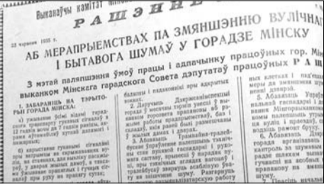
Спецыяльнае рашэнне Мінгарвыканкама аб змяненні вулічнага і бытавога шуму. Увабачце, сучасныя аўтамабільныя раней нават часова станкі машын у жылых дварах былі забаронены!

Яшчэ адна скразная тэма друку — 6-я гадавая перамога, у якой прадпрыемствы запланаваана перавесці на 7-гадзінны працоўны дзень без зніжэння заробку рабочых і служачых. Ударнікі працы, у сваю чаргу, заклікаюць «закрыць» пяцігодку ў два гады і абяцваюць перавыканаць вытворчыя планы — на 150, 180 і нават 200 працэнтаў. Праўда, ужо ў 1959 годзе замест завешанага пяцігадовага плана быў абвешчаны сямігадовы, які мусіў узняць усе галіны эканомікі, у тым ліку за кошт інтэнсіфікацыі сельскай гаспадаркі і развіцця высокатэхналагічнай вытворчасці, і значна палепшыць умовы жыцця насельніцтва. Замяжыкі друк нездарма назваў агучаным паказчыкі «грандыёзным праграмай будаўніцтва камунізму». Напрыклад, толькі сярэдняга адукацыя на Савецкім Саюзе павіна была ахапіць 38—40 мільёна чалавек — на 10 мільёнаў больш, чым у 1958 годзе. Гэтыя ж маштабныя задачы былі пастаўлены абсалютна ва ўсіх сферах, ад прамысловасці і сельскай гаспадаркі да медыцынскага абслугоўвання.