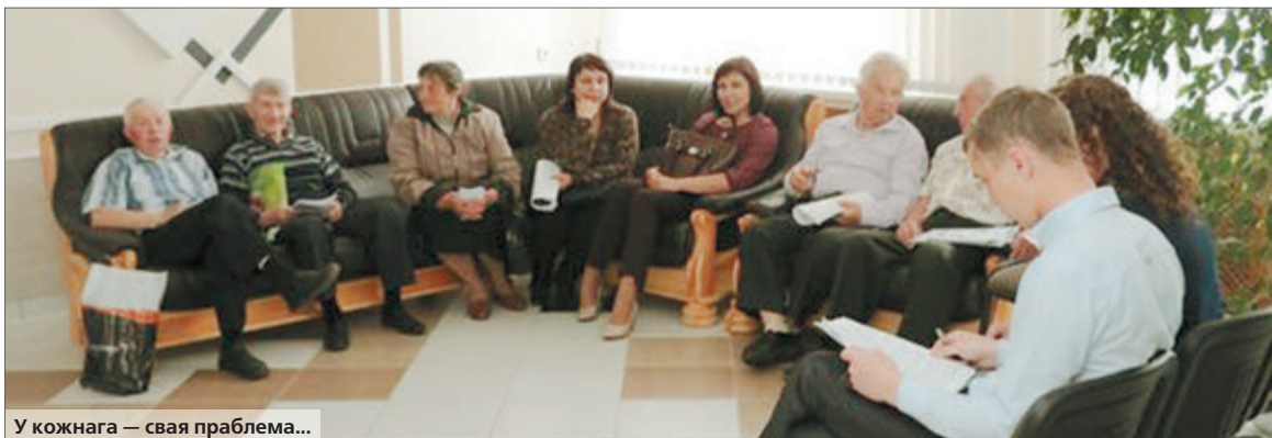
У кожнага — свая праблема...

Улады Гродна ў першую чаргу ідуць насустрач тым зваротам, якія маюць сацыяльную накіраванасць, і дапамагаюць не толькі камусьці аднаму, але і іншым. Напрыклад, па просьбе жыхара дома па вуліцы Фурсенкі тут літаральна нядаўна ўладкавалі каля пад'езда электрапад'ёмнік і пандус. Пасля звароту жыхаркі з вуліцы Таўлая замянілі лаўкі і ўстанавілі яшчэ адну паміж паліклінікі і прыпынкам транспарту. Зараз разглядаецца пытанне