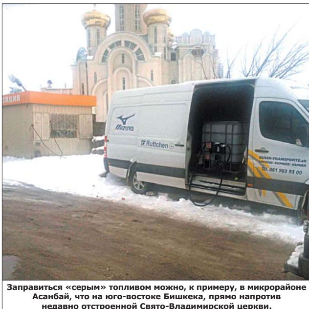
Заправиться «серым» топливом можно, к примеру, в микрорайоне Асанбай, что на юго-востоке Бишкека, прямо напротив недавно отстроенной Свято-Владимирской церкви.