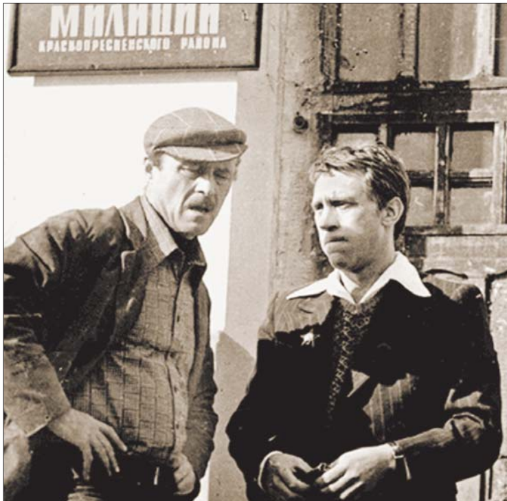
Станислав ГОВОРУХИН и Владимир ВЫСОЦКИЙ во время съемок картины «Место встречи изменить нельзя».