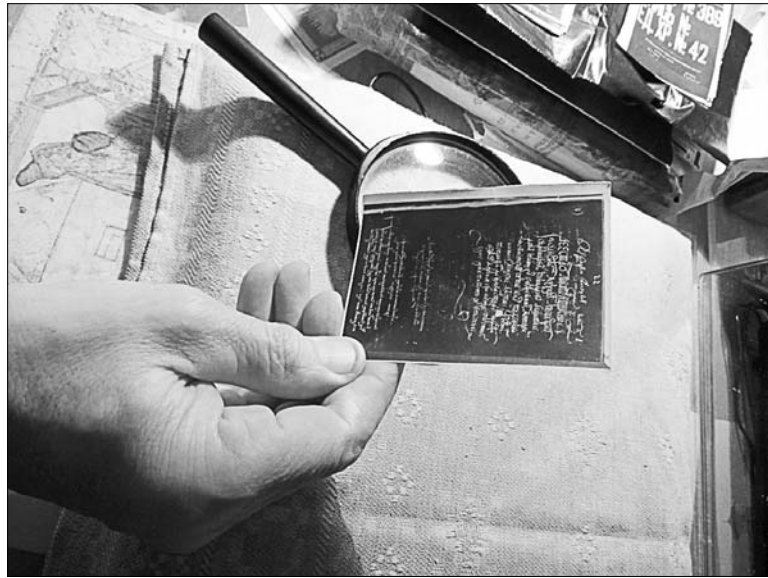
Праца над «Метрыкай» пачынаецца з такіх фотакопіяў.

Тут можна даведацца пра прафесіі, якія існавалі ў той час, што за людзі абслугоўвалі двор вялікага князя. Так, стральчы выконвалі даручэнні пры двары і егерскую службу (паляванне і догляд за пушчамі). Нашталеры — страмянныя, даглядалі за коньмі. Зброю рабілі платнеры, халодную зброю — ручніцы. Пушкары абслугоўвалі гарматы. Пры двары розныя абавязкі выконвалі адверныя. Зэкгармістар рамантаваў і вырабляў гадзіннікі. Былі і фельчары, і бальверы (апошнія лячылі службовых асоб), ляснічыя, мерчыя, кухары,