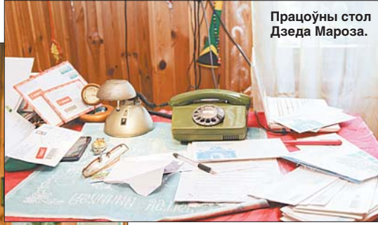
Працоўны стол Дзеда Мароза.

— Два гады таму я атрымаў ліст. Бацька прасіў дапамагчы яго сыну з ДЦП прайсці дэльфінацыйную — да гэтага ён не