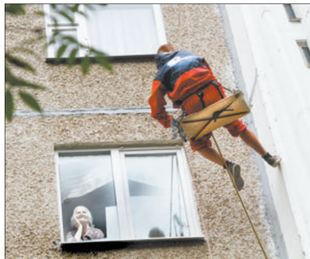
Рэакцыя жыхароў на будаўнічых альпіністаў можа быць і такой замілаванай.

Яны ніколі не хадзілі ў горы, аднак прафесійна караскаюцца па сценах і дахах. Уцяпляюць, фарбуюць, мыюць фасады дамоў летам, збіваюць ледзяшы са стрэх узімку, а здараецца... і ратуюць людзей. Прамысловыя альпіністы працуюць, гадзінамі вісячы на абвязках каля сцен дамоў. Жыхары рэагуюць на іх па-рознаму: хтосьці праз акно талерку супу прапануе, а хтосьці ножыкам спрабуе вярнуць перарэзаць.