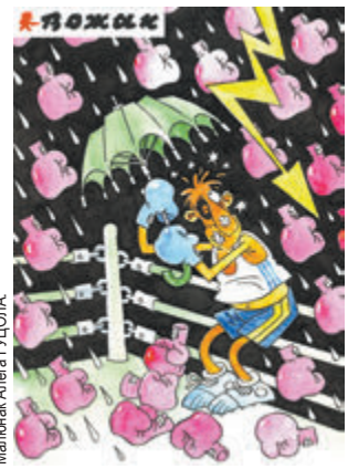
Малюнак Анастасі ГУЦЮПА

Учора бачыў прадуманую бойку: біліся проста каля ўваходу ў траўмапункт.