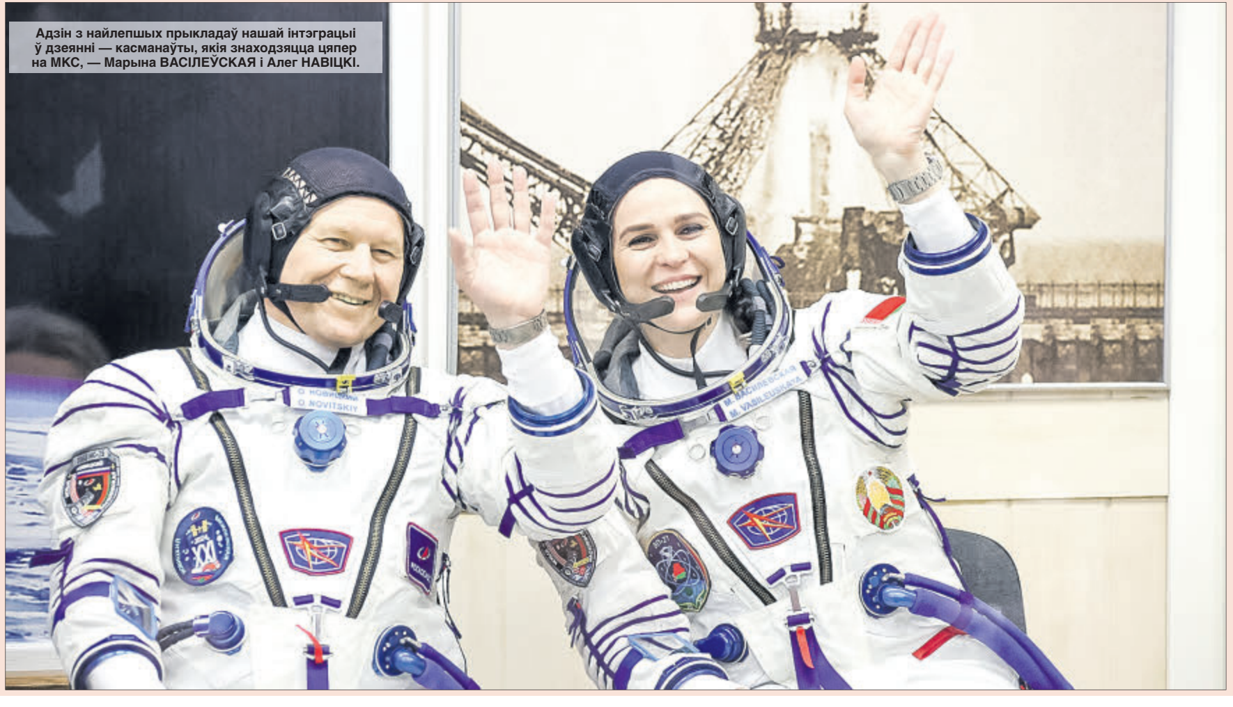
Адзін з найлепшых прыкладаў нашай інтэграцыі ў дзеянні — касманauta, якія знаходзяцца цяпер на МКС, — Марына ВАСІЛЕУСКАЯ і Алег НАВІЦКІ.

Дарагія сябры! Сярдэчна віншую вас з Днём яднання народаў Беларусі і Расіі. Гэта святая вось ужо чвэрць стагоддзя ўвасабляе волю брацкіх народаў разам уладкоўваць агульны саюзны дом дзеля будучых пакаленняў. За невялікі па гістарычных мерках перыяд мы шмат чаго дасягнулі і можам па праве ганарыцца сваімі поспехамі. Нягледзячы на ​​няпростыя знешнія ўмовы, нам удалося не дапусціць спаду вытворчасці, захаваць занятасць і дынаміку развіцця эканомікі. Выпускаецца канкурэнтаздольная інавацыйная прадукцыя, рэалізоўваюцца высокатэхналагічныя праекты ў атамнай энергетыцы, аўтамабіле- і станкабудаванні, транспарце. Расце доля айчынных камплектавальных і распрацовак. Крок за крокам мы асвойваем новыя рынкі, узяты курс на скарачэнне затрат і павышэнне якасці саюзных тавараў і паслуг. Беларусь і Расія упэўнена ідуць да навукова-тэхналагічнага суверэнітэту і знаходзяць неабходныя рэзервы для далейшага развіцця. Бачныя вынікі ёсць не толькі ў традыцыйных галінах. Рэальныя поспехі, сапраўдныя прарывы дасягнуты па такіх найскладанейшых, навукаёмкіх кірунках, як матэрыялазнаўства, авіябудаванне, мікраэлектроніка і касмічныя даследаванні. Упершыню ў гісторыі незалежнай Беларусі на МКС працуе беларуская касманauta.