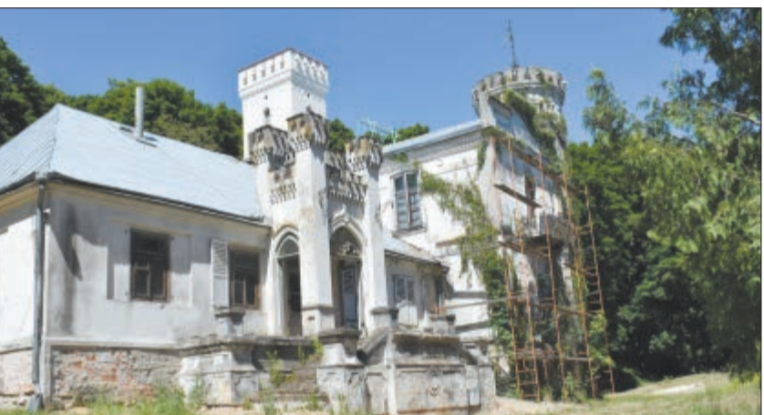
На былой сядзібе ў Падароску будзе турыстычны комплекс.

Падароску сядзібу рода Чачотаў-Бохвіцаў сярэдзіны XIX стагоддзя. Дугі час тут была кантора мясцовага сельскага гаспадаркі, але з 2002 года будынак пуставаў. Некалькі разоў яго спрабавалі прадаць з аўкцыёну, і нарэшце знайшоўся пакупнік.