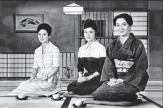
Кадр з фільма «Позняя вясень».