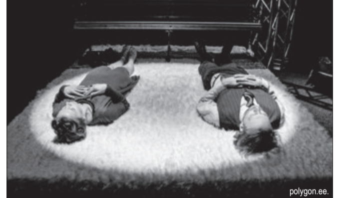
Сцена з пастановкі «Убаччы ружовага слана» 2013 года ў PolygonTeater.