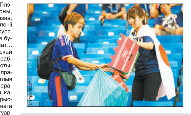
Матэрыялы падрыхтаваў Іван КУПАРБАС.

У японскіх школах прыборка класу, туалетаў — неад'емная частка адукацыі. Дзядей змалку вучаць класіфікацыі аб чысціні месцаў агульнага карыстання. У выніку ў дарослым жыцці японцы кіруюцца прывітай звычайнай аўтаматычна прыборка за сабой, дзе ён былі — дома ці на стадыёне. Вельмі надрэчны, а калі казачы больш дакладна, вельмі выдатны і патрэбны прыклад для пераймання.