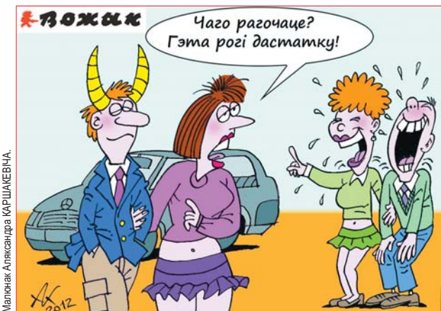
Малюнак Аляксандра КАРШКЕВІЧА.

Да цяжарнасці я спала на жываце! Падчас цяжарнасці — на баку! Пасля нараджэння дзіцяці магу спаць нават стоячы!