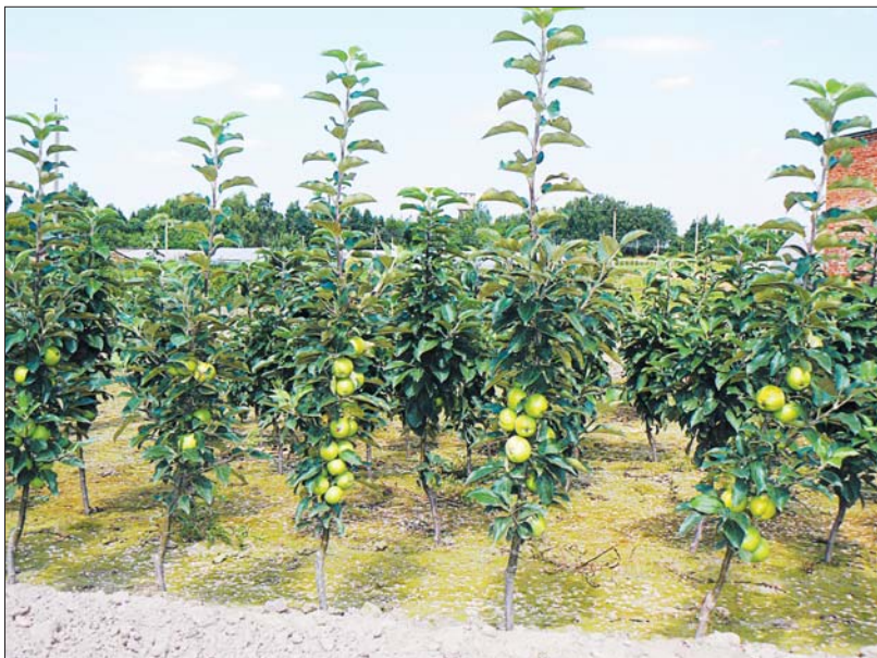
Тэхналогія вырошчвання яблыні ў супершчыльных пасадах (27 тыс. шт. на 1 га, сорт «Прэзідэнт»).