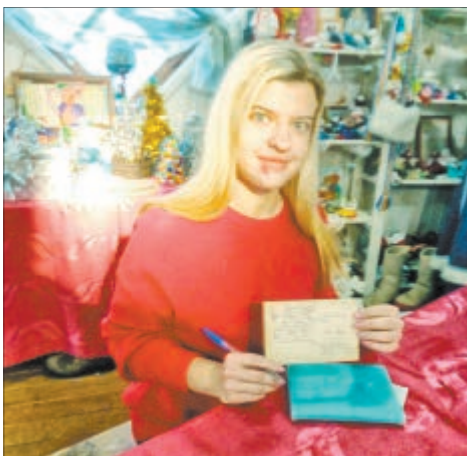
Карэспандэнт «Звязды» напісала на паштоўцы самае патаемнае...

— Часта дзеці просяць, каб бацькі перасталі піць, — кажа Дзядуля Мароз, — але вось адна дзяўчынка, якая летась пісала мне гэта пажаданне, сёлета даслала такое пiсьмо: «Дзед Мароз, вялікі дзякуй, што вы выканалі маё заветнае жаданне. Наш тата больш не п'е, ходзіць злы як чорт, дзверцамі халадзільніка ляскае. Калі ласка, вярніце ўсё як было».