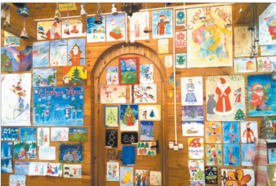
...разам з імі многія адпраўнікі дасылаюць свае малюнкi.