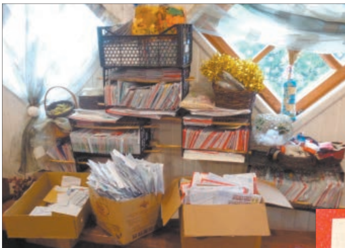
Лісты ад дзяцей і дарослых прыходзяць штодня...

— Такім людзям я тлумачу, што не мне пісаць трэба, а да доктара ісці, калі са здароўем бяда, — умешваецца дзядуля, — але калі акрамя мяне гэты апарат падарыць ніхто не зможа, то я ёй яго прывязу!