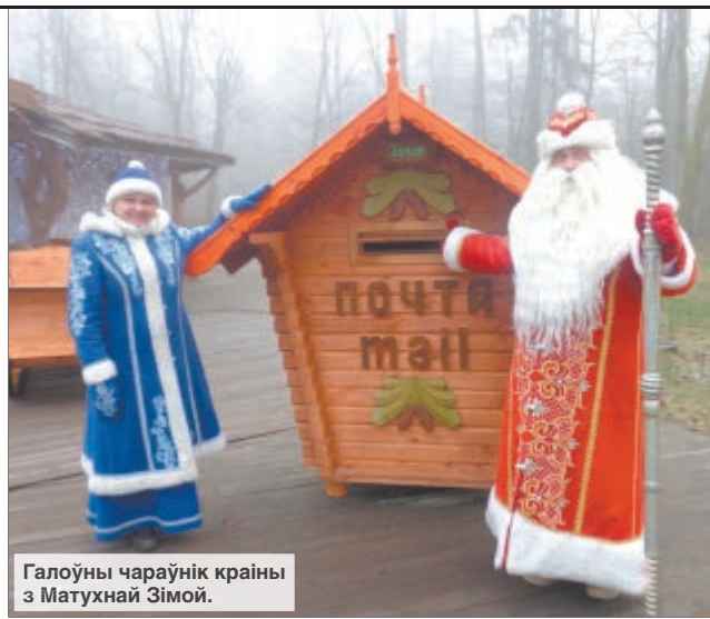
Галоўны чараўнік краіны з Матухнай Зімой.

— Гэтае пасланне мне напісаў непаўналетні падлетак з дзіцячай калоніі. Пасля яго пiсьма следам прыйшоў ліст ад мамы з такой жа просьбай. Ну і што мне было рабіць? Я патэлефанавала ў калонію для непаўналетніх, прадставіўся, растлумачыў ім сітуацыю. Спачатку яны доўга смяліся вынаходліваці хлопчыка, а потым расказалі, які ён «добры», якія ў яго «подзвігі» на рахунку разам з мамай на пару.