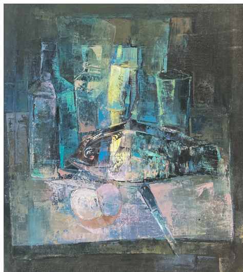
«Нацюрморт з рыбай», 1995 г.