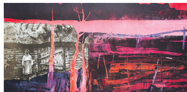
«Прадчуванне», 2022 г.

Марыя Сыракваш нарадзілася ў Мінску ў 2000 годзе. Прафесію спасцігала ў Мінскай дзяржаўнай гімназіі-каледжы мастацтваў (2008—2019 гады), затым у Беларускай дзяржаўнай акадэміі мастацтваў, на адзяленні графікі. Удзельнічае ў групавых выстаўках, арганізоўвае персанальныя, не абыходзіць увагай і конкурсы. Марыя Сыракваш працуе ў разнастайных графічных тэхніках, сярод якіх — лінарыт, гравюра на кардоне і пластыку, малюнак вугалем. Спрабуе сябе таксама ў галіне акварэльнага жывапісу.