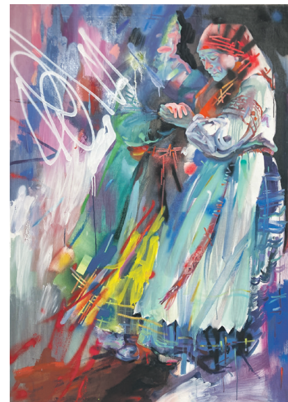
«Абарак», 2023 г.

Першае, што кідаецца ў вочы пры знаёмстве з выстаўкай, — усё тая ж дынаміка, хоць, дарэчы, і не паўсюдная. Мастачка смела пазбаўляецца сіметрыі, эксперыментуе з кантрастам форм, тонаў, фактуры. Хоць ад відавочнага дысбалансу пакуль адмаўляецца — тут бачыцца толькі перспектыва. Не новае, але для Беларусі нязвычайнае — Марыя Сыракваш злучае традыцыйныя