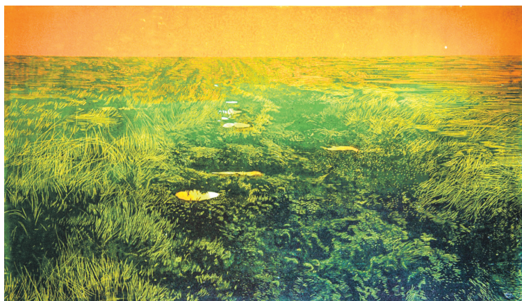
«Захад», 2021 г.