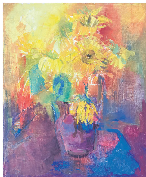
«Змена гамы. Нацюрморт. Апошні», 2019 г.